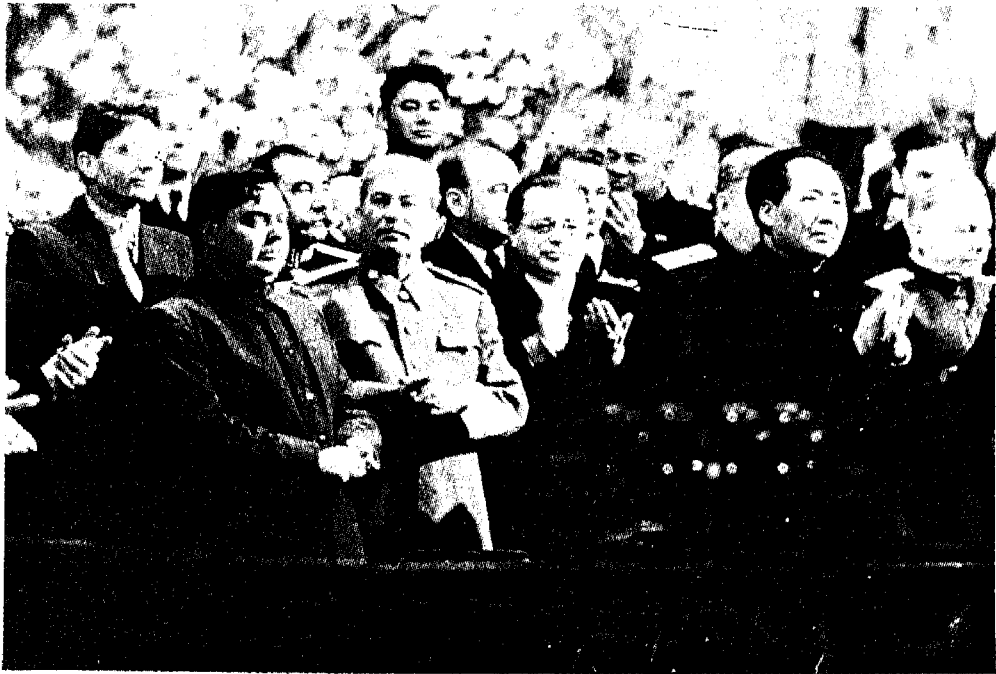
ستالين وماو تسي تونغ، ويبدو مالينكوف إلى يمين ستالين والمارشال فوروشيلوف في أقصى اليسار إلى جانب الزعيم الصيني.